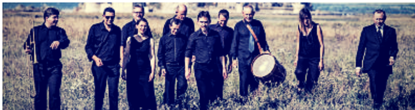
Ensemble Douce Mémoire

Les chantres du roi de France et d'Angleterre y estoient, et fut fortement et sumptueusement chanté